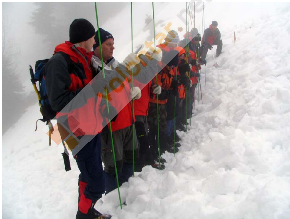
Kratke, z navojnim vretenom sestavljive lavinske sonde.

Kdaj so prvič prišli na idejo, da bi s prebadanjem plazovine iskali zasute niti ni tako važno. Precej dolgo je tega ko sta bili na tržišču dve vrsti sond. Bilgerjeva, ki je ostala še iz prve svetovne vojne, elementi so se sestavili s pomočjo vijakov, pretežno so jo uporabljali v nemško govorečih državah (Avstrija, Nemčija) in Lindenmannova lavinska sonda, ki smo jo po vzoru Švicarjev uporabljali tudi Slovenci.