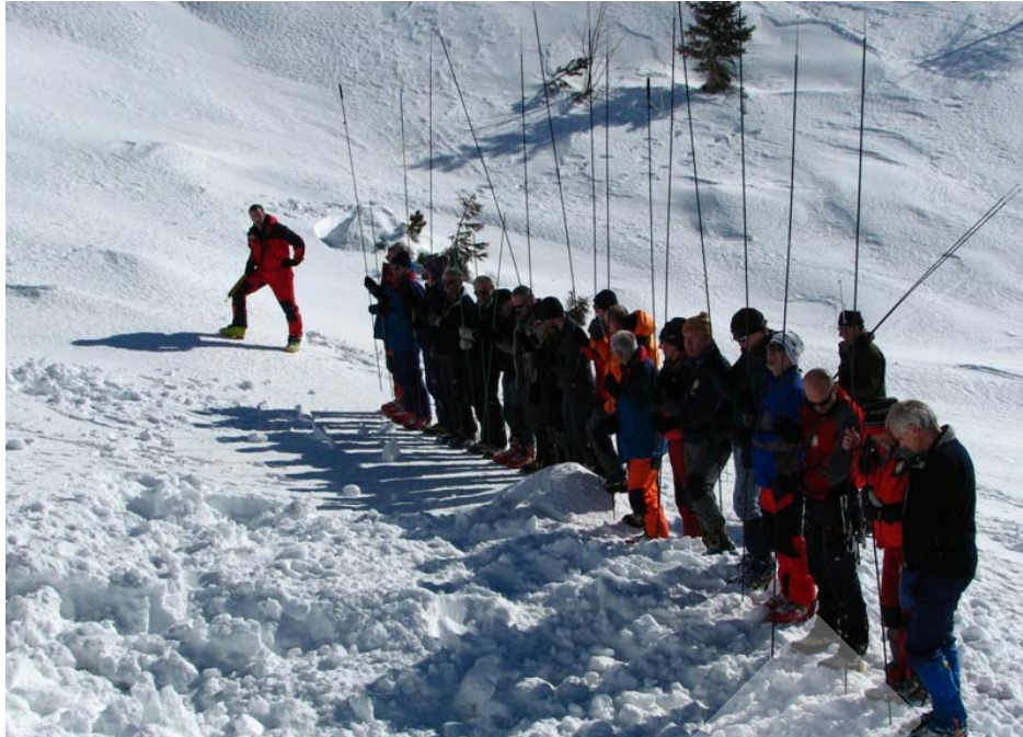
Sonderska vrsta gorskih reševalcev. Sonde so dolge štiri metre. Plazovino prebadajo do dna.

Sonde naslednje generacije so predvsem lažje in krajše, konica pa je topo zaobljena. Zobci niso več potrebni, ker so današnja oblačila iz umetnih, gladkih vlaken. Uporaba je že davno prerasla okvire reševalnih služb. Dokazano je, da čas od začetka iskanja z lavinsko žolno pa do izkopa občutno zmanjšamo, če v zadnji fazi določanja mesta zasutega uporabimo sonde. Hitri pregled in grobo sondiranje kritičnih mest na plazovini ne zahtevata lavinske sonde dolžine štiri metre, zato so sonde namenjene gornikom in turnim smučarjem dolge od 240 do 320cm. V glavnem so iz aluminija ali karbona.